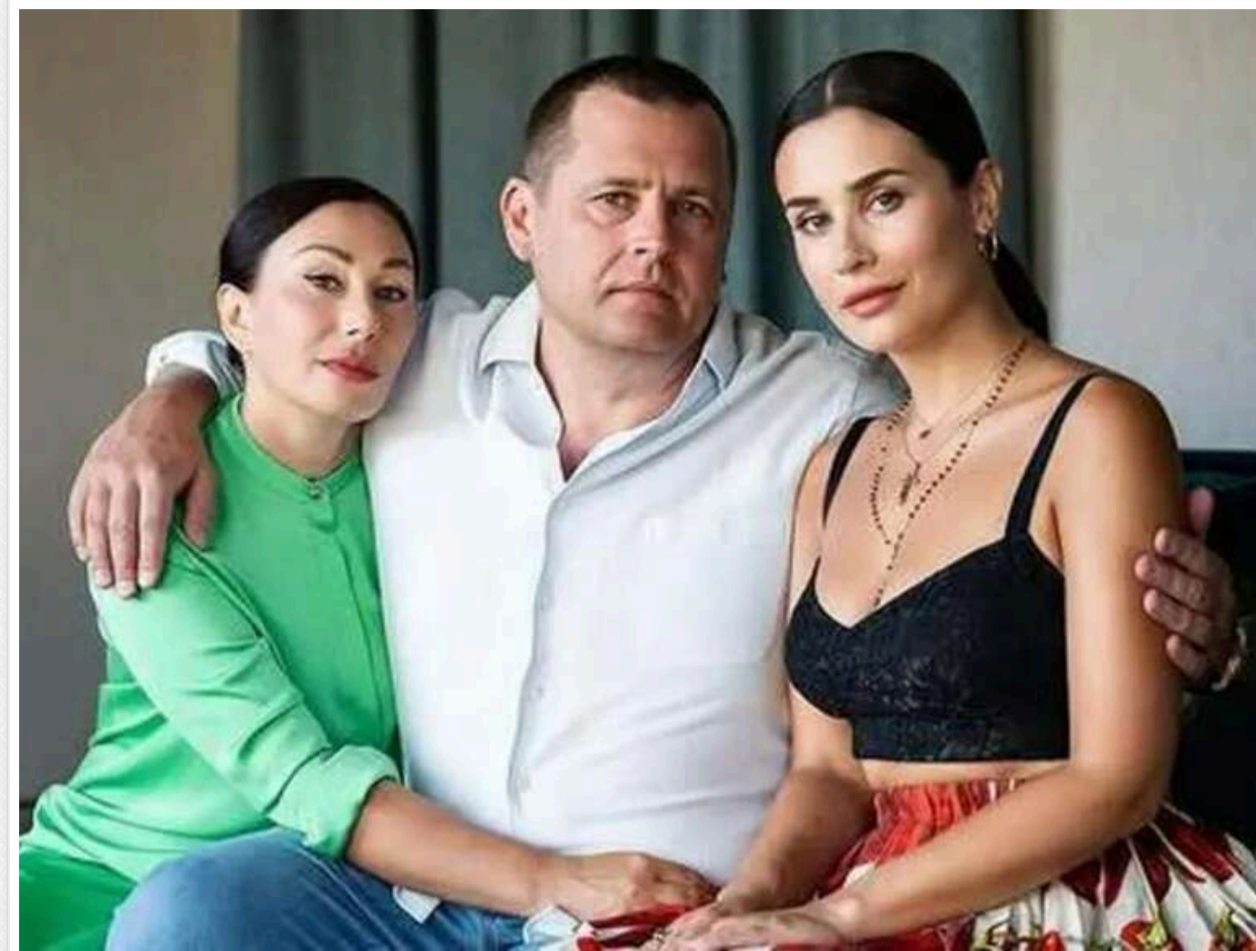
Вілла на Комо за 8 мільйонів євро: у мережі з'явилися дані про майно доньки мера Дніпра, Філатов назвав це російською ІПСО

Читати на руському Read in English Додати як бажане джерело в Google