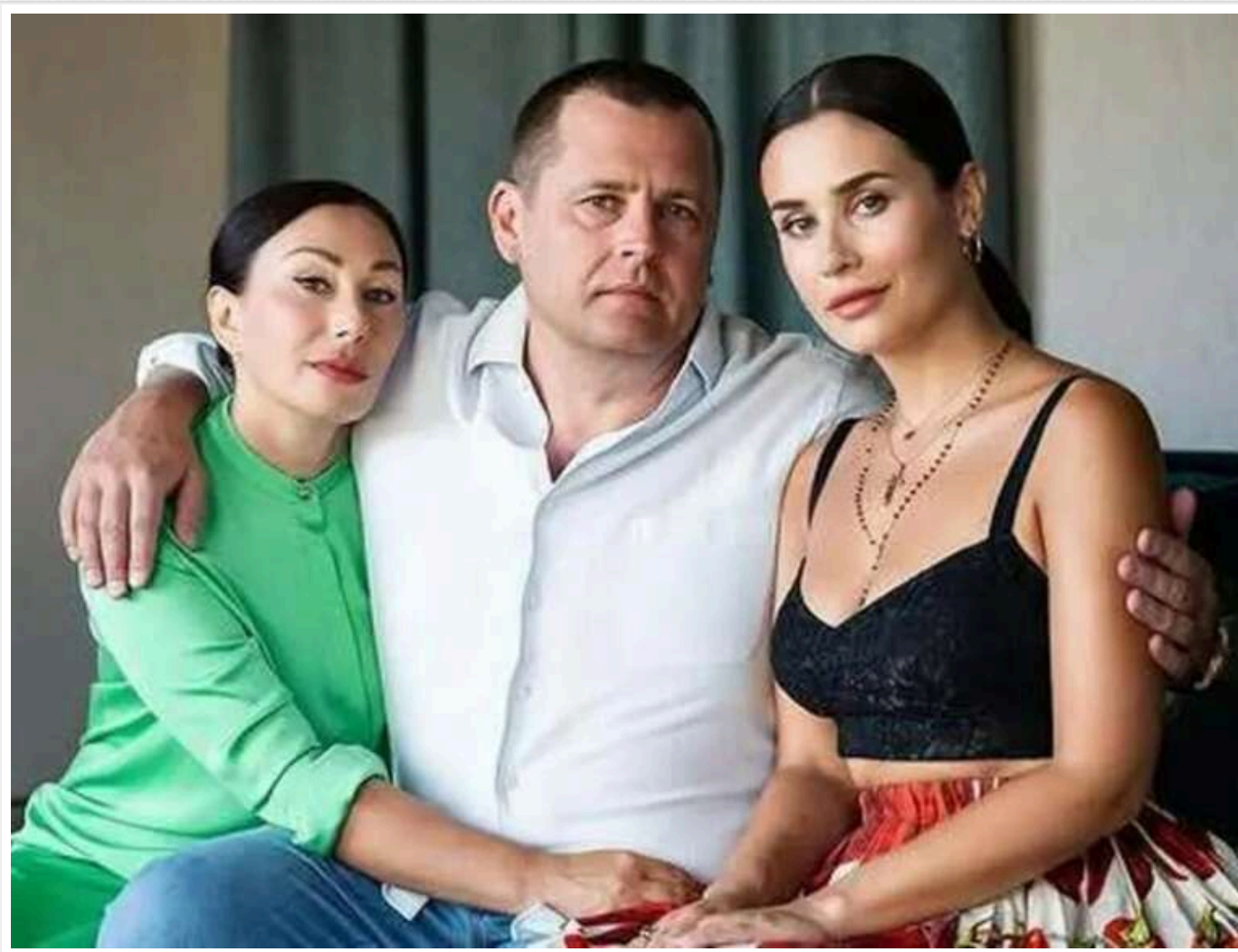
Вілла на Комо за 8 мільйонів євро: у мережі з'явилися дані про майно доньки мера Дніпра, Філатов назвав це російською ІПСО