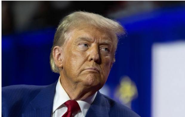
Фото: Дональд Трамп (Gettyimages)

Президент США Дональд Трамп став фігурою, навколо якої українські чиновники запропонували незвичайну концепцію територіального врегулювання, що дістала умовну назву "Донніленд".