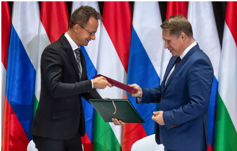
Міністр закордонних справ Угорщини Петер Сійярто та міністр охорони здоров'я Росії Михайло Мурашко

📌 0 🐦 0 📖 ЧИТАТИ НОВИНУ РОСІЙСЬКОЮ 👁️ 5759