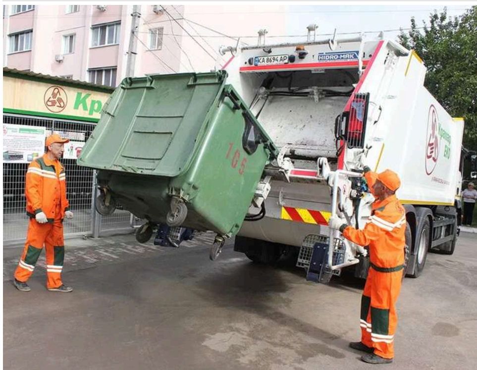
У Києві підвищують тарифи на вивезення сміття: перевізники пояснюють зростанням цін на пальне

У Києві сміттєперевізники підвищують тарифи на вивезення відходів через зростання цін на пальне.