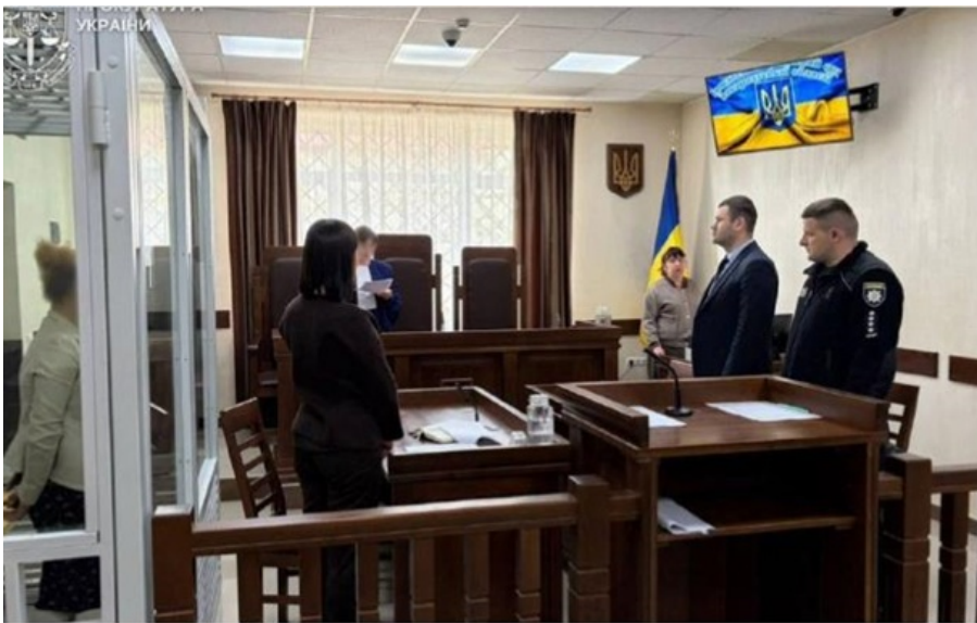
Підозрювана перебуває під вартою

Жінці повідомлено про підозру - торгівля людьми, вчинена щодо малолітніх із використанням їхнього уразливого стану.