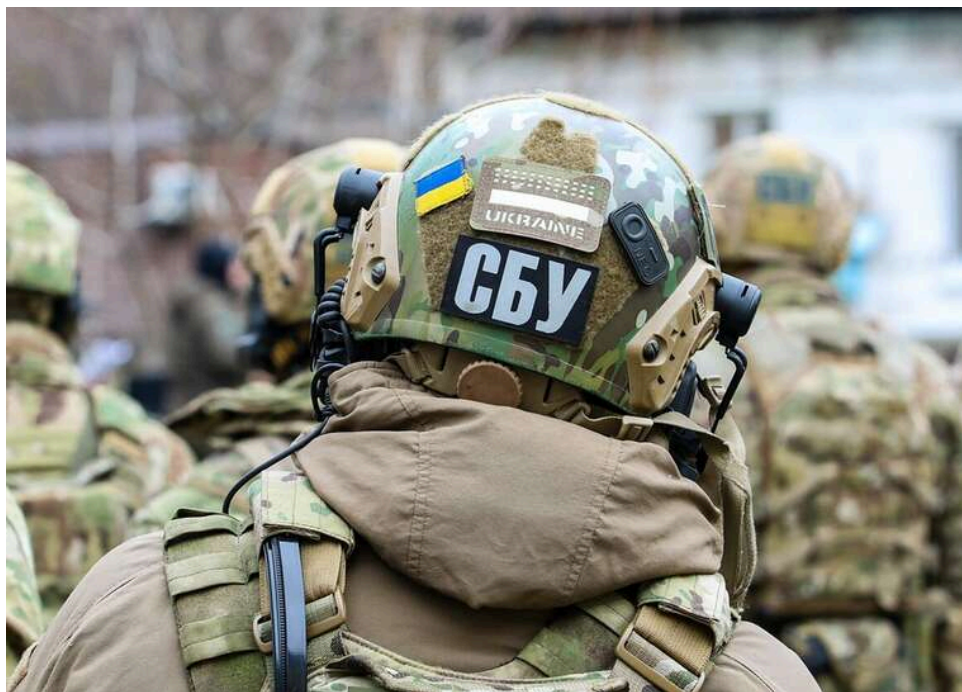
СБУ зірвала теракти у Кременчуці: затримано 17-річного агента РФ

Контррозвідка Служби безпеки запобігла новим терактам на Полтавщині. Завдяки діям на випередження затримано неповнолітнього агента рф, який готував одразу два вибухи в Кременчуку.