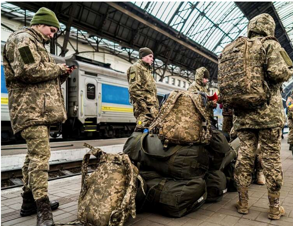
Мобілізація на довгу дистанцію: у Раді припустили можливість зниження призовного віку в разі ескалації

В Україні можуть зменшити вік мобілізації, оскільки війна триватиме ще довго.