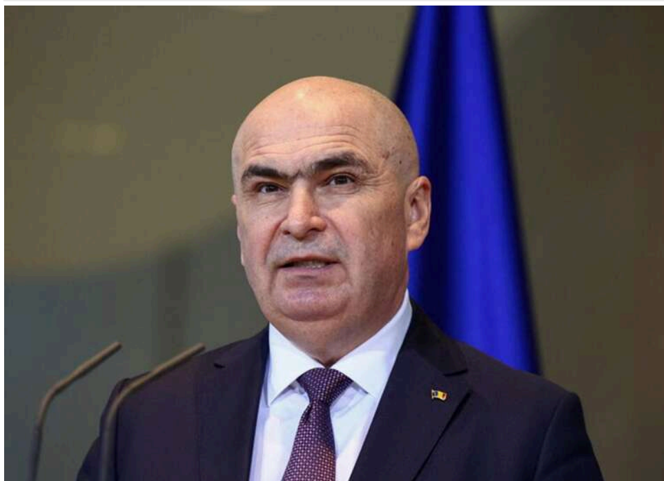
Розпад коаліції в Румунії: прем'єр Боложан відмовився йти у відставку та готує уряд меншості

Прем'єр-міністр Румунії Іліє Боложан заявив про свої плани розпочати переговори з коаліційними партіями для формування уряду меншості після того, найбільша в урядовій коаліції Соціал-демократична партія Румунії (PSD) відклікала свою підтримку його кандидатури.