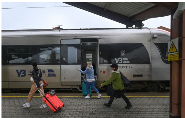
Фото: поїзд "Інтерсіті"

У компанії "Укрзалізниця" повідомили про ДТП на залізничному переїзді у Львівській області, де вантажний автомобіль зіткнувся з пасажирським поїздом.