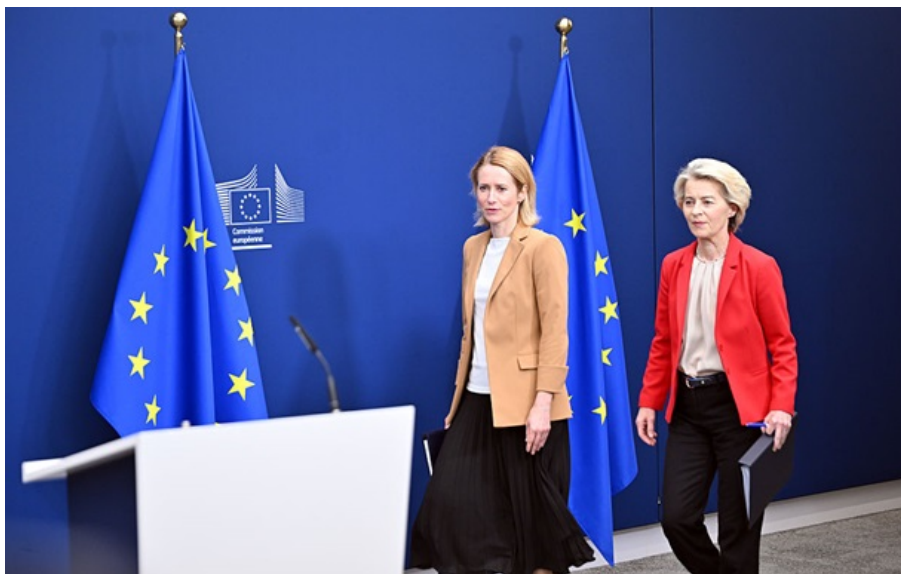
Кая Каллас та Урсула фон дер Ляєн

Важливо, щоб переговори щодо довгострокового вирішення цього конфлікту тривали, наголосили в Європі.