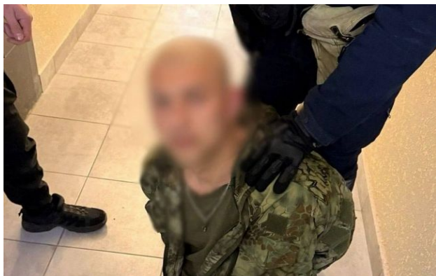
Фото: чоловік зі зброєю в руках розгулював у ЖК Києва

Поліцейські Києва затримали 37-річного чоловіка, який ходив із автоматом по житловому комплексу. В його квартирі виявили карабін, рушницю і сотні набоїв.