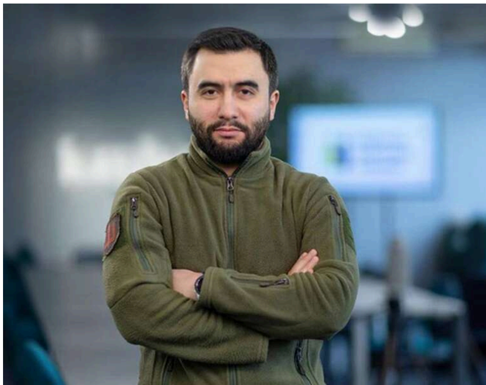
«Чорні списки» чи корупційна каса: Чому прості рішення не зупинять постачальників на кшталт Глиняної