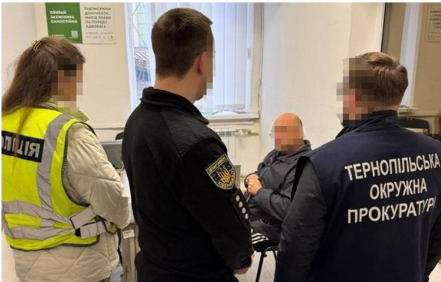
Фігурант отримав підозру

Під час обшуку у підозрюваного на його ноутбучі виявили понад 80 файлів, що належать до дитячої порнографії.