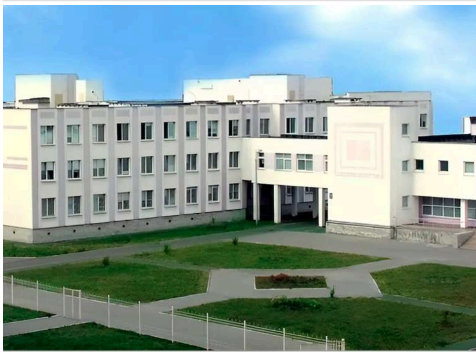
Тендери для «своїх»: Дарницька РДА віддала 58 мільйонів фірмі експомічника депутата Київради Гончарова

Управління освіти Дарницької РДА 15 квітня за результатами тендеру замовила ТОВ «Інтеграл Буд-Стандарт» ремонт фасаду ліцею за 57,85 млн грн.