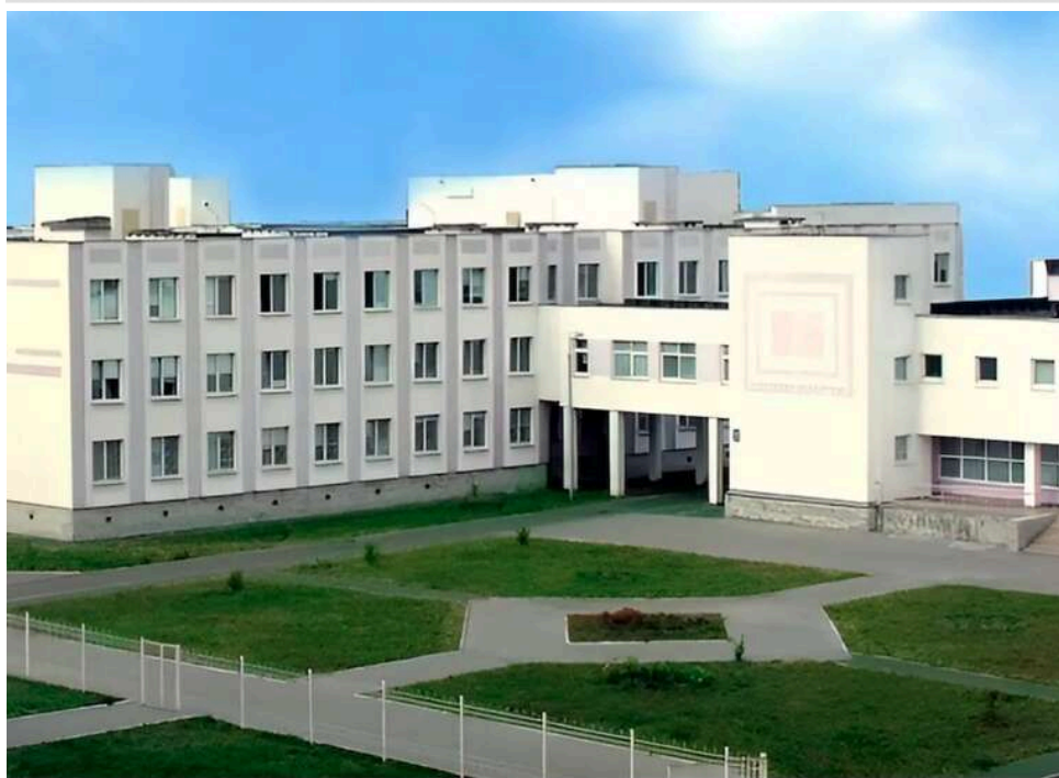
Тендери для «своїх»: Дарницька РДА віддала 58 мільйонів фірмі експомічника депутата Київради Гончарова

Управління освіти Дарницької РДА 15 квітня за результатами тендеру замовила ТОВ «Інтеграл Буд-Стандарт» ремонт фасаду ліцею за 57,85 млн грн.