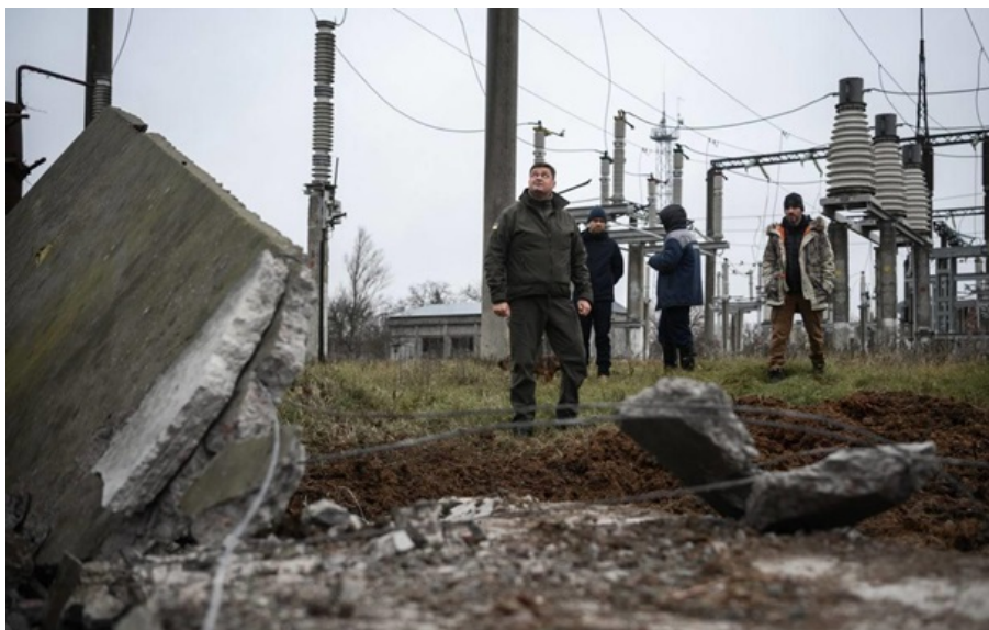
Є нові відключення у прифронтових регіонах

З 07:00 до 22:00 діятимуть графіки обмеження потужності для промисловості. А з 11:00 до 13:00 – будуть застосовуватись графіки погодинних відключень для населення.