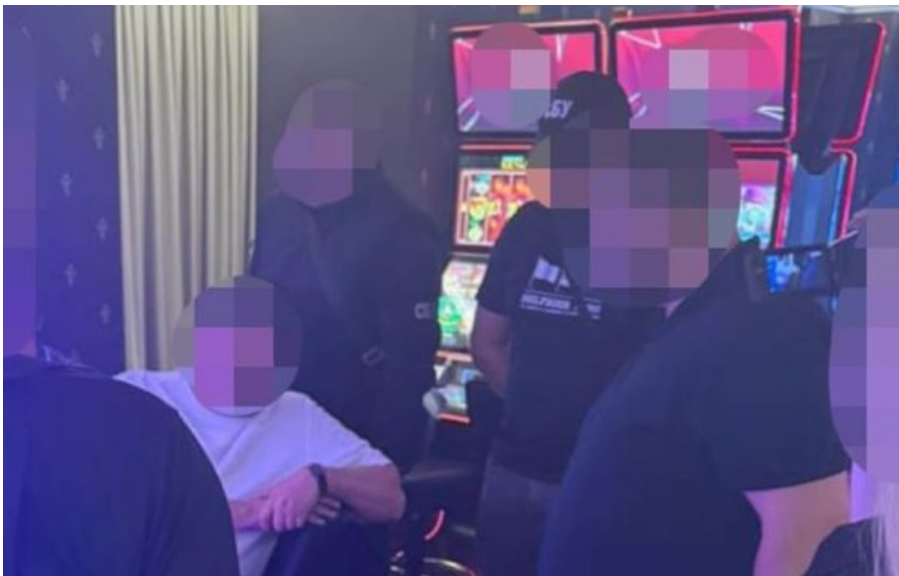
Офіцер ЗСУ відвідував гральні заклади під час "лікування"

Військовий підробив медичну довідку. Під час "лікування" він відвідував гральні заклади та витрачав значні суми грошей.