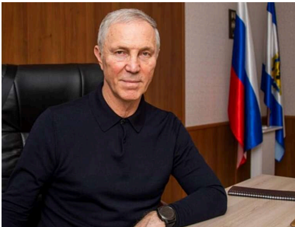
«Випадкове натискання кнопки»: у РФ озвучили нову версію невдалого замаху на Сальдо у херсонському ресторані

Російські силові структури надали нові подробиці нібито замаху на самопроголошеного губернатора Херсонської області Володимира Сальдо, що стався влітку 2022 року.