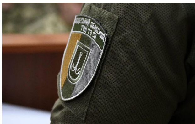
Фото: в Одесі затримали вісьмох представників ТЦК в Одесі

В Одеському обласному ТЦК та СП підтвердили затримання військовослужбовців. У Сухопутних військах оприлюднили деталі інциденту, однак згодом внесли зміни до публікації, прибравши згадки про розбій і викрадення 30 тисяч доларів.