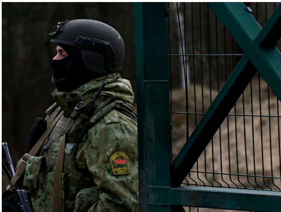
Військові об'єкти чи цивільна інфраструктура: Що насправді буде Білорусь біля кордонів із Чернігівщиною

У українському медіапросторі знову заговорили про загрози з боку лукашенківської Білорусі. Цього разу тему порушив ще 17 квітня сам Президент України. За словами Володимира Зеленського, у прикордонній зоні північного сусіда будуються дороги до північних територій України та облаштовуються артилерійські позиції. Деякі з цих об'єктів розташовані майже впритул до Чернігівського кордону.