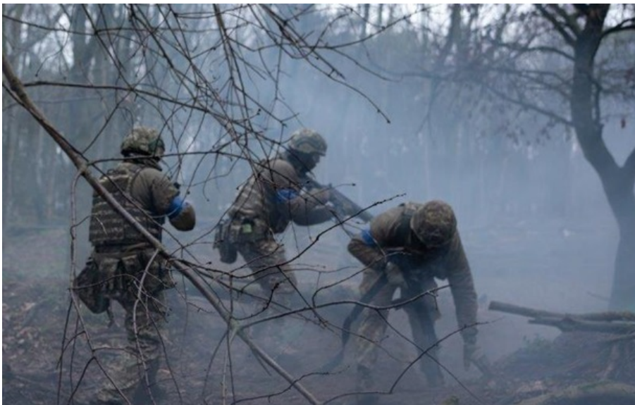
Фото: Генштаб ЗСУ / Facebook ЗСУ протистоять армії РФ

Уражено три райони зосередження особового складу і військової техніки, два пункти управління безпілотними літальними апаратами та артилерійську систему росіян.