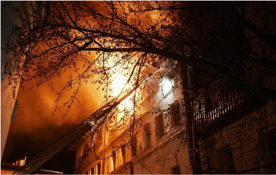
Пожар в Харькове

Попадания вражеских БПЛА зафиксированы в трех районах города - Киевском, Основянском и Салтовском.