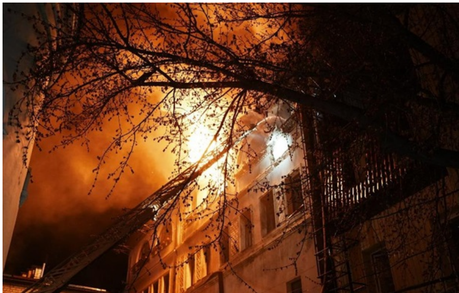
Пожар в Харькове

Попадания вражеских БПЛА зафиксированы в трех районах города - Киевском, Основянском и Салтовском.