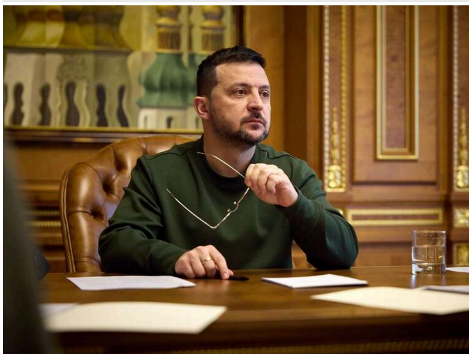
Українська «оборонка» готова подвоїти обсяги: Зеленський заявив про можливість виробництва зброї на 60 мільярдів доларів

Україна вже спрямовує близько 30 млрд доларів у власний оборонно-промисловий комплекс, водночас українська «оборонка» здатна наростити виробництво щонайменше удвічі.