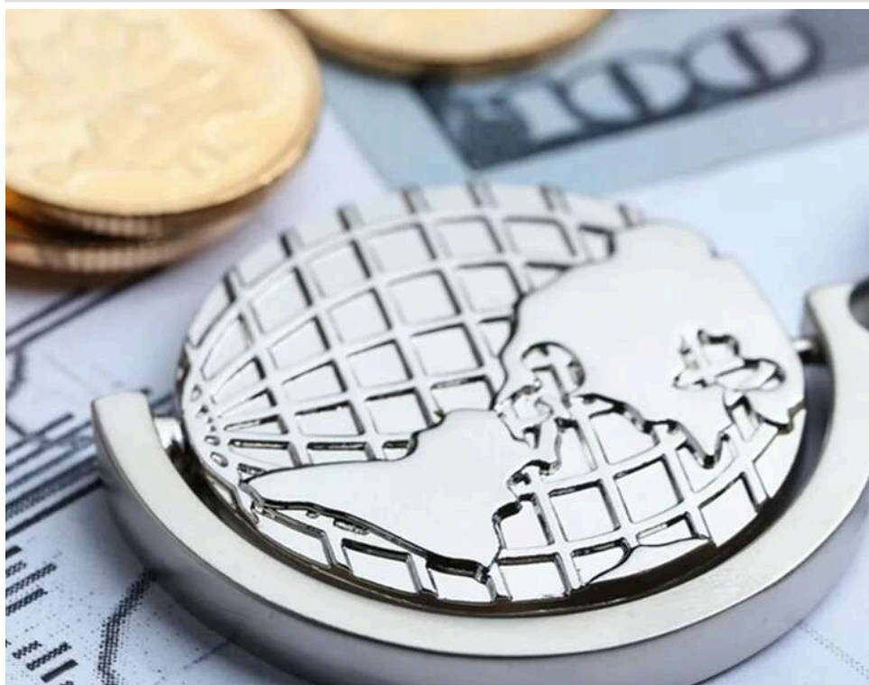
МВФ б'є на сполох: світовий держборг наближається до рекордів часів Другої світової війни

МВФ попереджає: світ наближається до безпрецедентної боргової кризи.