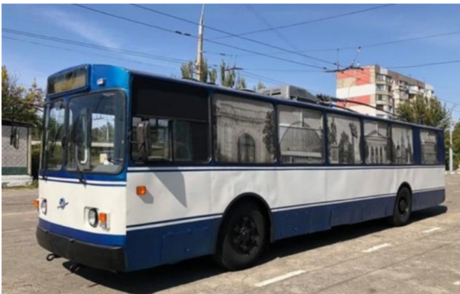
(ілюстративне фото)

У Херсоні тимчасово не працюють тролейбуси