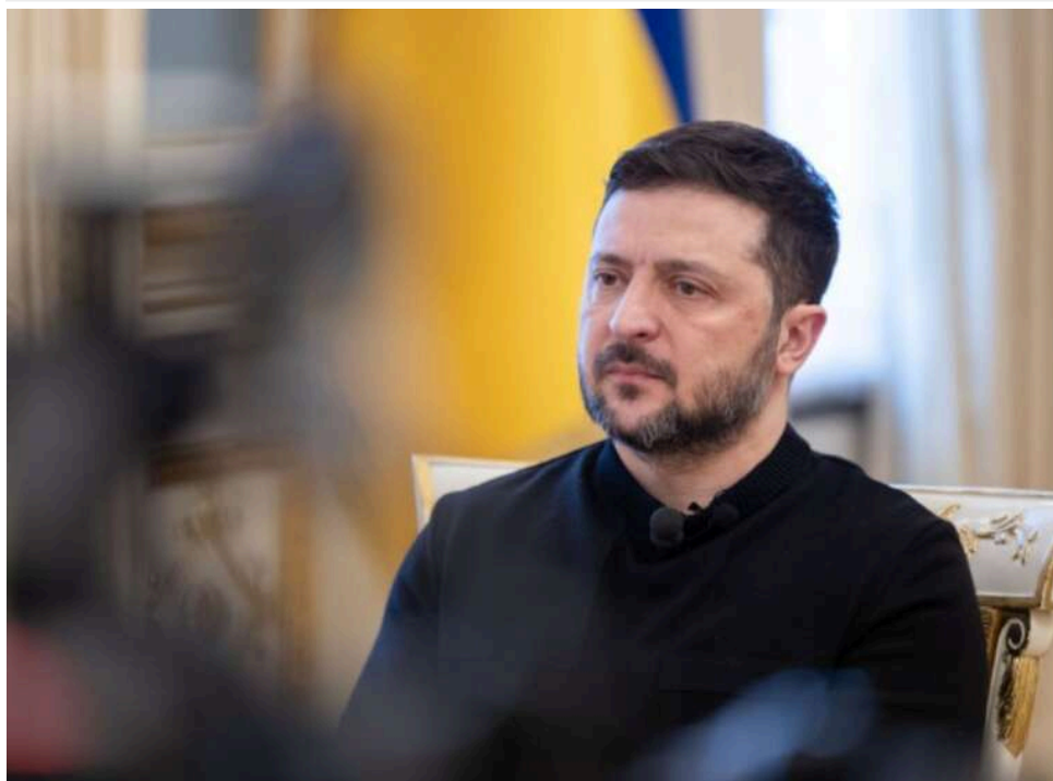
Зеленський: Війна в Ірані може послабити тиск США на Росію

Через війну в Ірані Штати можуть послабити тиск на Росію, заявив Зеленський.