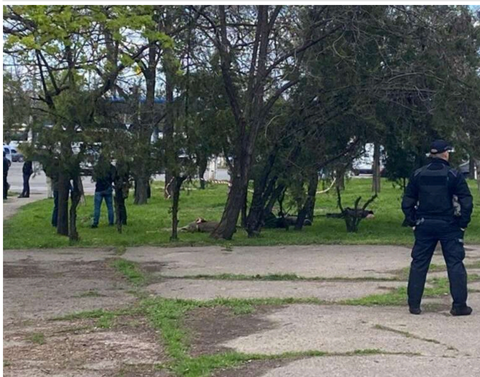
Вимагали понад 2 мільйона гривень: В Одесі СБУ затримала вісім співробітників ТЦК, які «полювали» на великих клієнтів