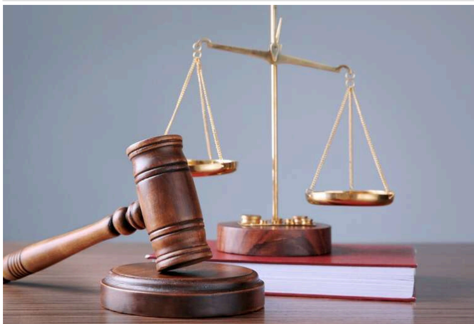
Аюрведа «інкогніто»: в Києві суд покарав відправника з Індії за спробу завезти тонни препаратів на підставну особу

Аюрведична «контрабанда» за схемою фіктивного отримувача: суд покарав відправника з Індії.