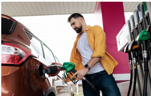
Фото: ціни на АЗС пішли вниз

Популярні мережі АЗС переписали цінники на ДП та автогаз. Власники дизельних авто можуть заправитися вигідніше.