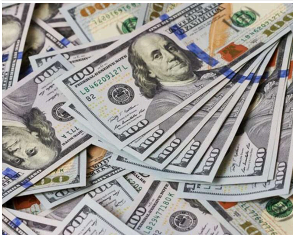
Долари у прокладках та кросівках: в Одесі суд виніс вердикт жінці, яка надіслала з Ізраїлю «валютну» посилку

Гроші в прокладках і кросівках: як українка з Ізраїлю намагалася надіслати до Одеси посилку з 20 тисячами доларів.