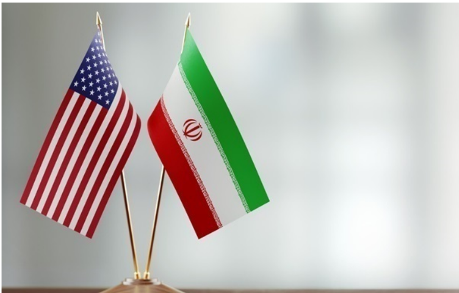
Іран та США домовилися про припинення вогню

США та іран домовилися про припинення вогню; Росіяни двічі за день били по маршрутках на Нікопольщині. Є загиблі. Кореспондент.net виділяє головні події вчорашнього дня.