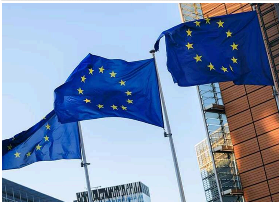
Євросоюзу загрожує нормування товарів: Крістін Лагард попередила про наслідки блокади Ормузької протоки

Президентка Європейського центрального банку Крістін Лагард попередила, що Євросоюзу може загрозувати раціонування товарів у зв'язку з блокадою Ормузької протоки.