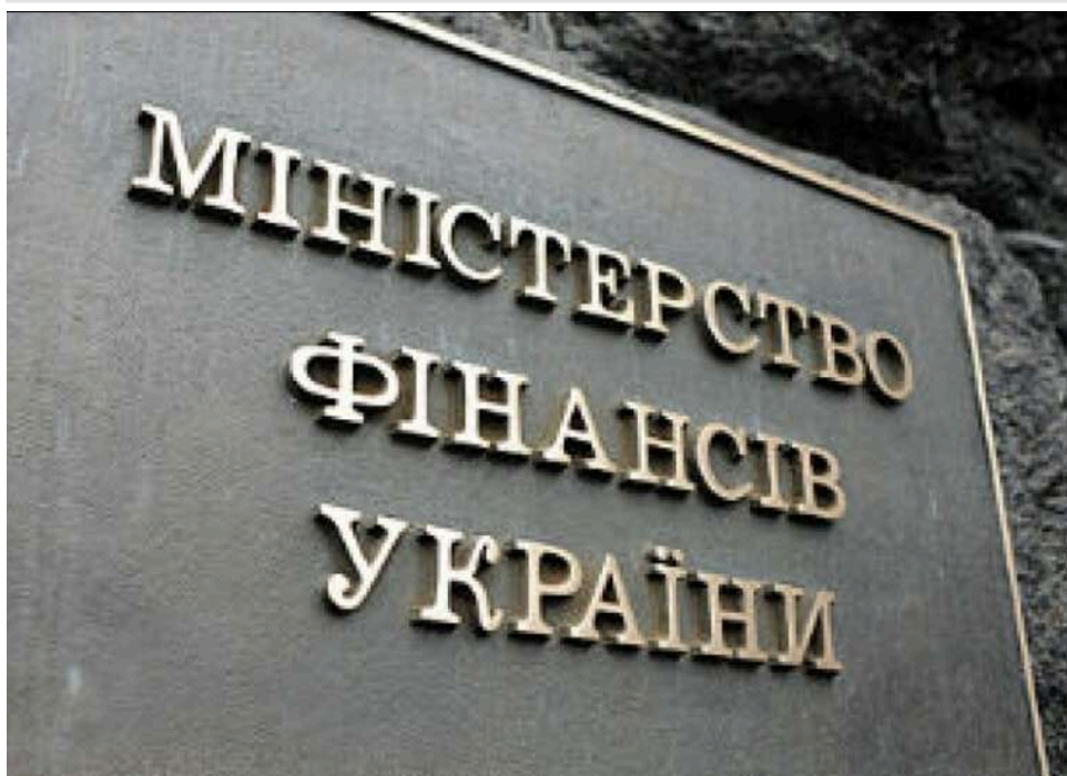
Україна домовилась із кредиторами про відстрочку виплат держборгу до 2030 року

Україна досягла угоди з кредиторами щодо продовження строків платежів за державним боргом до 2030 року.