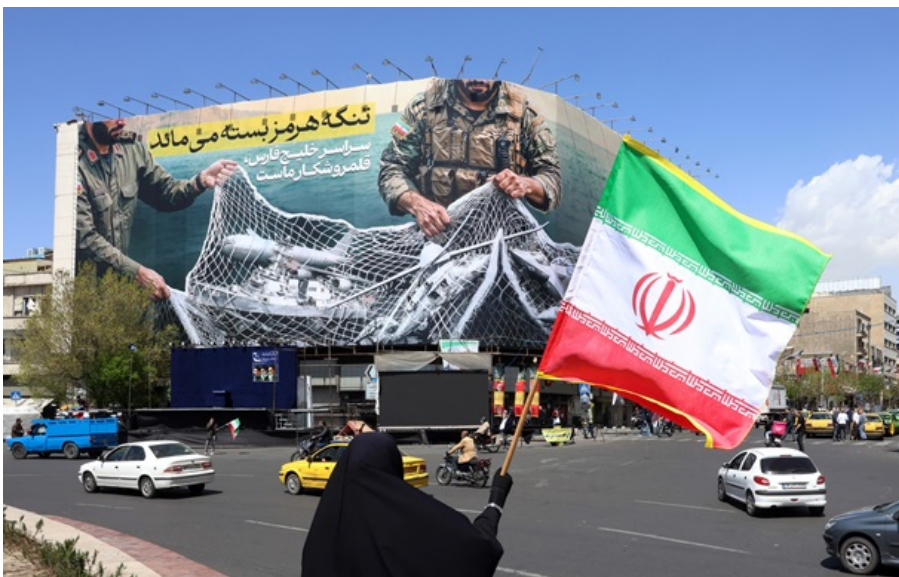
Іран заявив про поразку США

Тегеран розкрив зміст 10 пунктів, на які начебто погодився Вашингтон. Серед них - виплати компенсації Ірану.