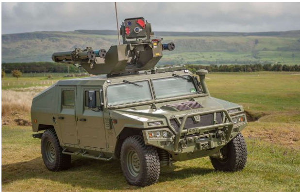
Фото: Rapid Ranger з недорогими ракетами проти "Шахедів" доповнив українську ППО (Thales.com)

Високу ефективність у знищенні дронів росіян демонструють британські зенітно-ракетні комплекси Rapid Ranger, які виявляють цілі ворога на відстані до 15 кілометрів.