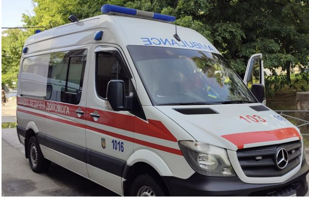
Фото: Підірв гранати на Дніпропетровщині призвів до поранення п'яти поліцейських (facebook.com AMBULANCEZP)

П'ятеро правоохоронців отримали поранення, коли п'яний місцевий житель кинув у них дві гранати під час затримання на Дніпропетровщині.