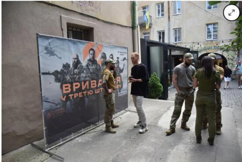
An army recruitment center in Lviv, Ukraine.

By Volodymyr Verbianyi and Olesia Safronova