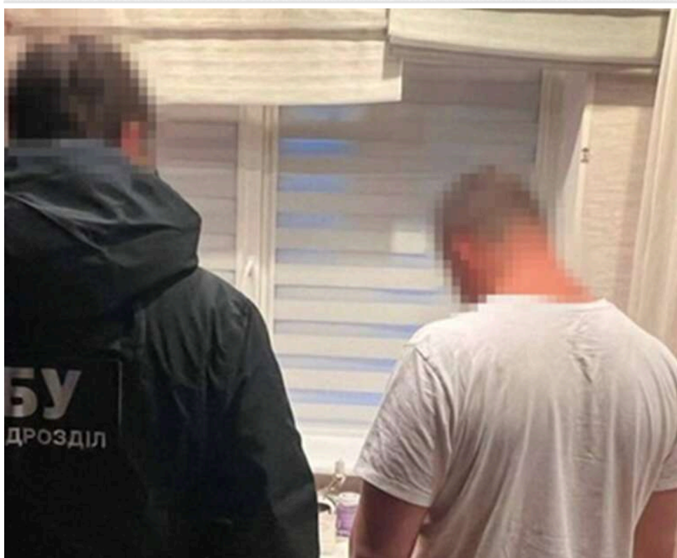
Приховав ще 340 мільйонів: депутату Полтавської міськради оголосили нову підозру за незаконне збагачення

СБУ та Національна поліція зафіксували нові правопорушення депутата Полтавської міської ради, якого в жовтні 2025 року викрили в маніпуляціях із декларуванням доходів.