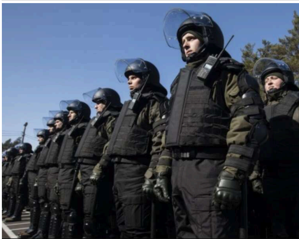
До війни можуть залучити поліцію, Нацгвардію та військових пенсіонерів, – депутат

Наступними на війну можуть відправитись поліцейські, нацгвардійці, прикордонники, військові пенсіонери та чоловіки в запасі.