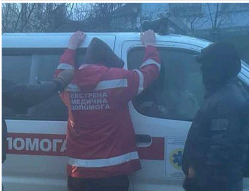
Спецоперація СБУ на Одещині: троє лікарів у кареті швидкої допомоги перевозили ухиянтів до Придністров'я

СБУ повідомляє про затримання в Одеській області трьох лікарів, які на машинах швидкої допомоги переправляли чоловіків у Придністров'я.