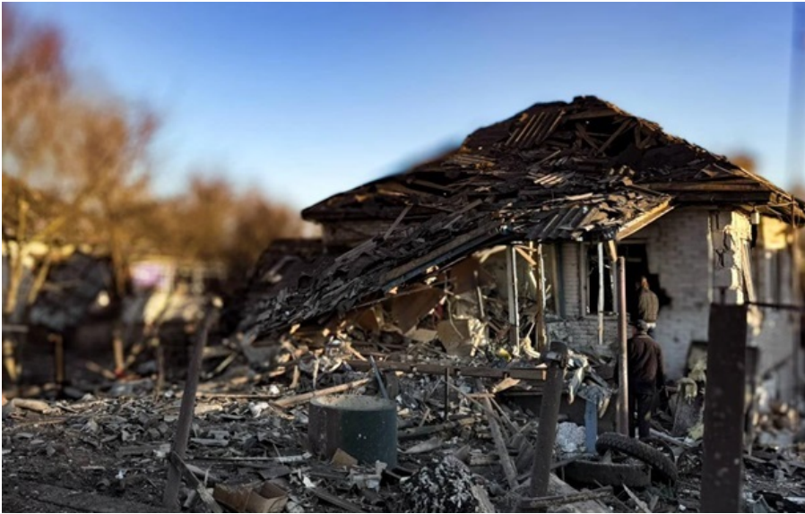
Наслідки одного з попередніх російських ракетного ударів на Сумщині

У Роменській громаді через влучання БПЛА у будинок загинув 42-річний чоловік. Постраждали також рідні загиблого.