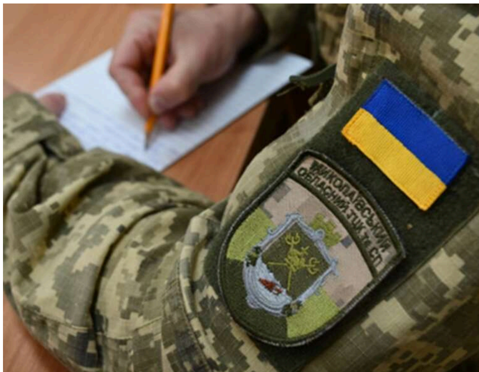
Порушення процедури та «подвійні» штрафи: Чернівчанин через суд зняв арешт із рахунків та скасував рішення ТЦК

Чернівецький районний суд міста Чернівців визнав протиправними дві постанови ТЦК про притягнення громадянина до адміністративної відповідальності. Вирішальним фактором стало порушення основних процесуальних гарантій – особу не повідомили належним чином про розгляд справ, а рішення ухвалили без її участі.