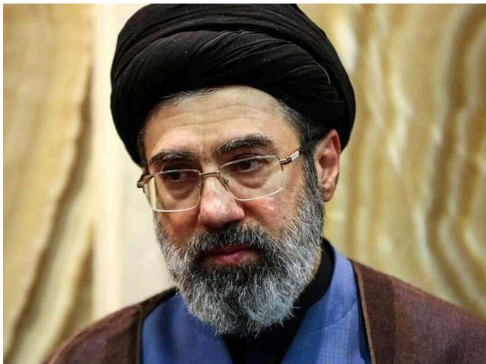
Зелене світло від Тегерана: Моджтаба Хаменеї схвалив прями переговори зі США в Ісламабаді

Вчора ввечері верховний лідер Ірану Хаменеї-молодший дав згоду на переговори зі США, повідомляє Axios з посиланням на джерела.