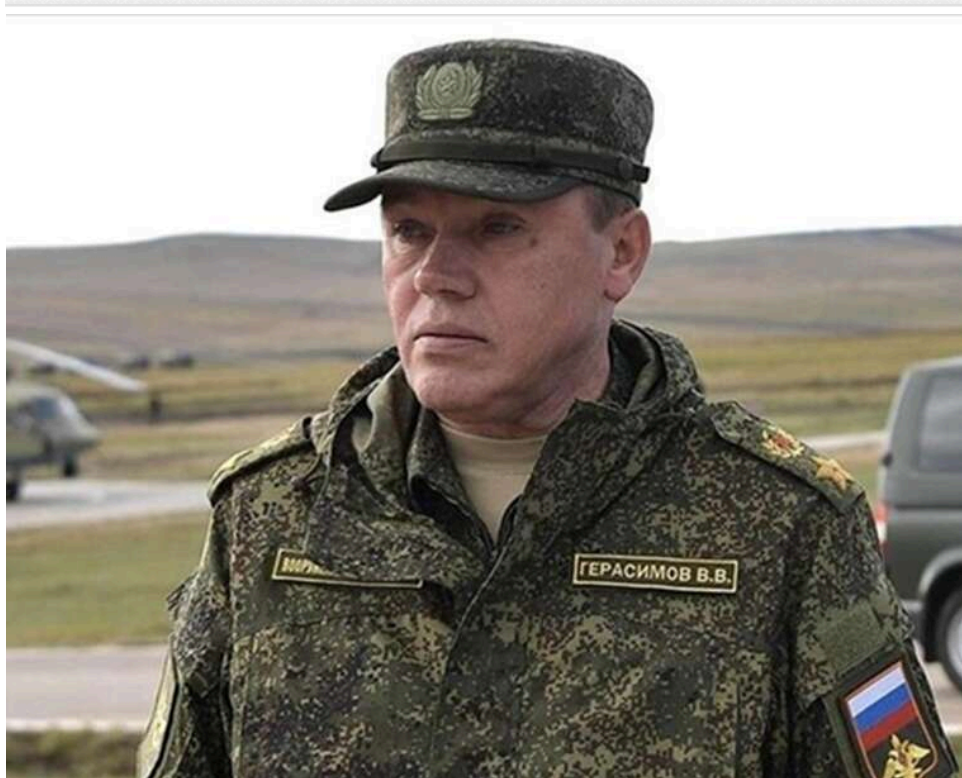
Герасимов заявив про наступ на Слов'янськ і Краматорськ та «зачистку» Нового Донбасу: Україна не підтверджує дані РФ