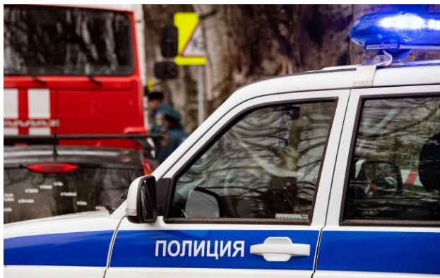
Фото: дрони атакували військову інфраструктуру у Ростовській області РФ

Ударні безпілотники атакували військову та транспортну інфраструктуру у кількох місцях в Ростовській області РФ.