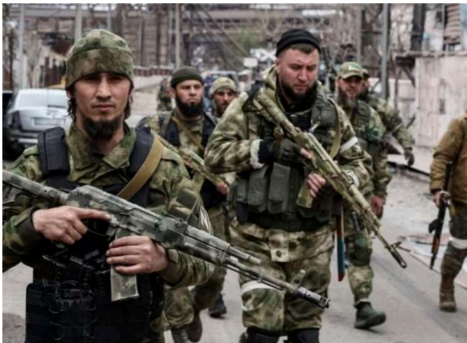
«Б'ють прикладами та грабують»: жителі Белгородщини скаржаться на мародерство кадіровців серед білого дня

Мешканці Белгородської області країни-агресорки Росії поскаржилися на військовослужбовців підрозділу "Ахмат". Вони звинуватили кадіровців у грабежі, а військову поліцію та місцеву владу – в бездіяльності.