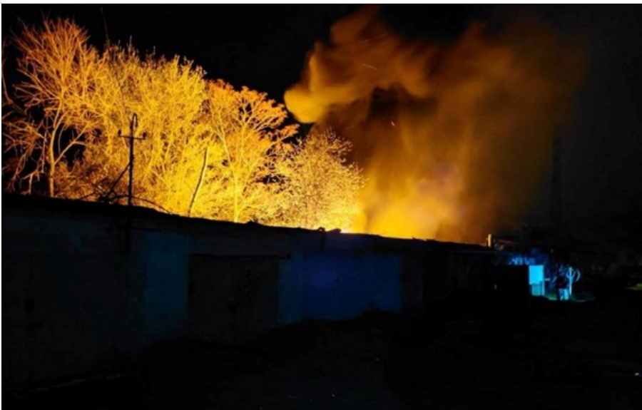
Наслідки удару по Запоріжжю