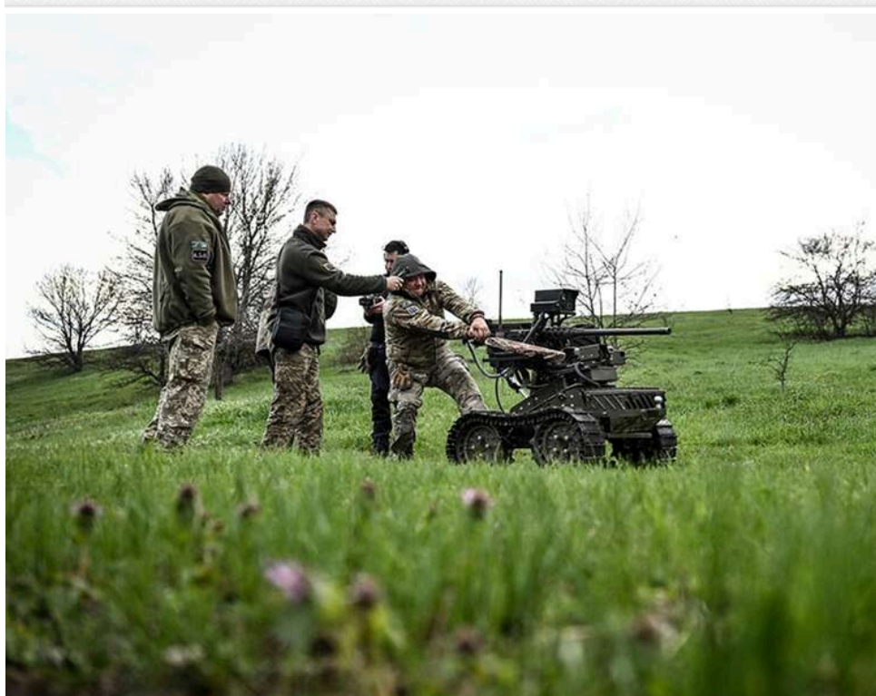
Міноборони готує повну автоматизацію фронту: наземні роботи ЗСУ штурмують позиції та беруть окупантів у полон без участі піхоти

Україна все активніше застосовує роботизовані системи на полі бою. Наземні дрони та БпЛА дозволяють ЗСУ штурмувати ворожі позиції і брати полонених, не залучаючи піхоту.